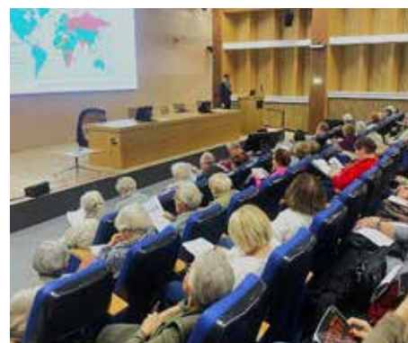
Wykład w UTW im. H. Szwarz w Warszawie