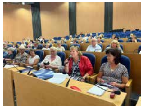
Gdańsk, V Pomorskie Forum UTWA=

Wykłady zakończyły się omówieniem roli szczepień ochronnych, które są kluczowym elementem profilaktyki, skutecznie chroniącym przed groźnymi następstwami choroby. Wykłady były prowadzone z wykorzystaniem przykładów klinicznych, ilustracji. Słuchacze UTW uczestniczyli w dyskusji, co dodatkowo pomogło wyjaśnić zarówno medyczne jak i praktyczne aspekty ochrony zdrowia w grupie wiekowej seniorów.